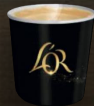
TASSES EN PAPIER