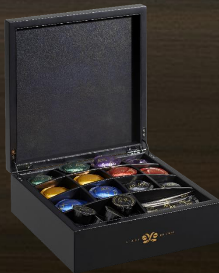
Kist voor vergaderzalen en hotelbars Inclusief verwijderbare vakken in de voorste rij, geheel in te delen naar uw voorkeur.