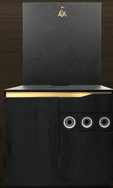
breedte: 90 cm

maakt het meubilair geschikt voor personen met beperkte mobiliteit.