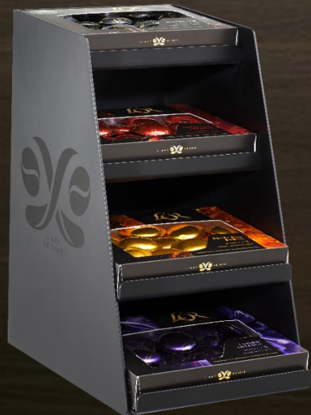
Displaystandaard Ideaal voor koffiecorners

Keuze uit twee stijlvolle display units.