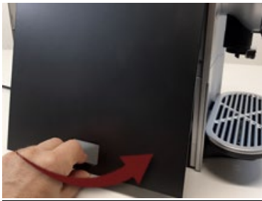
Plaats het zijpaneel terug.